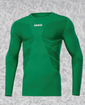
Longsleeve Comfort 2.0

Art. 4233-06 116-164 8,00€ Art. 4233-06 S-3XL 9,00€