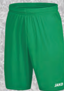
Sporthose Manchester 2.0

Art. 8850-06 128-164 19,80€ Art. 8650-06 S-XXL 22,80€