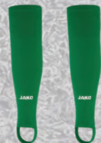
Stutzen Glasgow 2.0

Art. 6250-08 104-164 14,00€ Art. 6250-08 S-3XL 15,00€