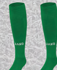
Stutzenstrumpf Glasgow 2.0