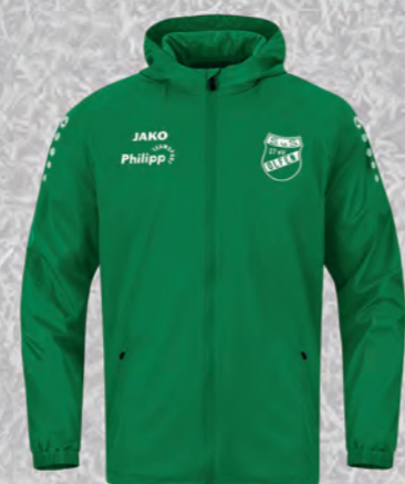
Allwetterjacke Team 2.0

Art. 6350-06 140-164 15,00€ Art. 6350-06 S-4XL 18,00€